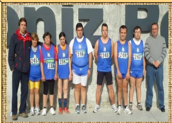
Equipa de Marcha Atlética – Lisboa