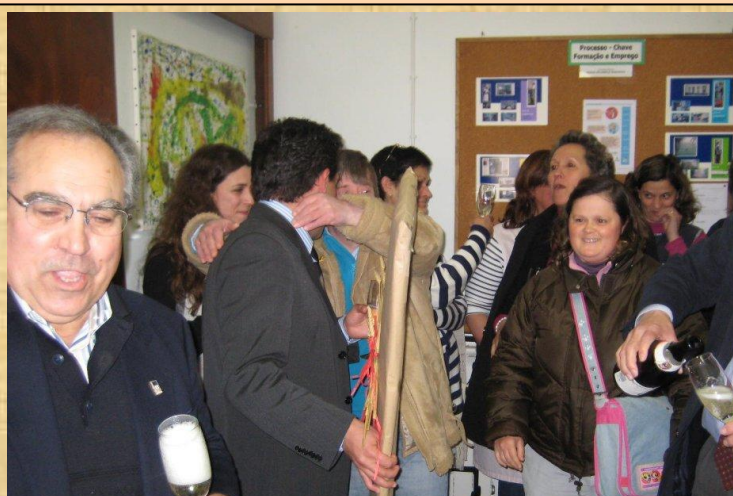
Comemoração da Certificação pelo Referencial EQUASS