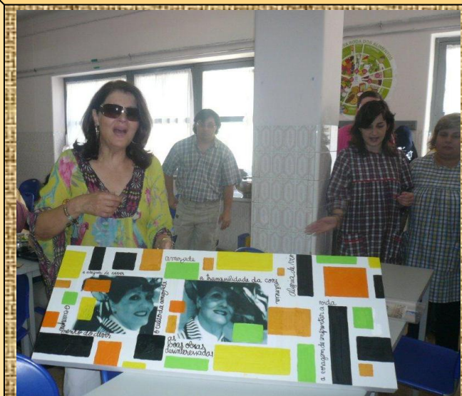
Despedida de uma das colaboradoras da APPACDM