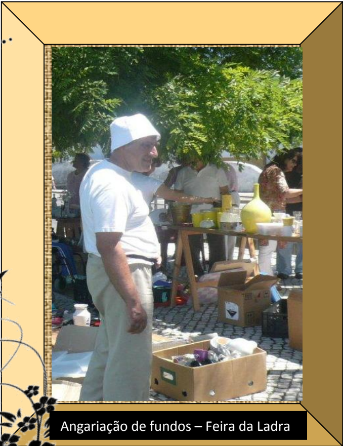
Angariação de fundos – Feira da Ladra