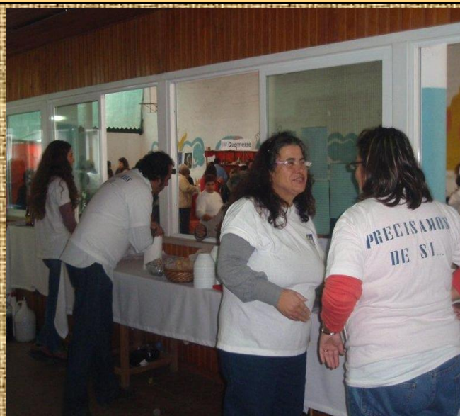
Angariação de fundos – São Martinho Solidário