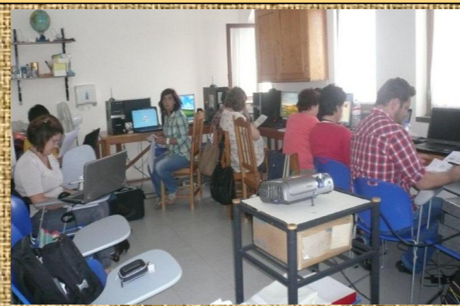
Projecto Urano – Formação de técnicos e significativos/pais