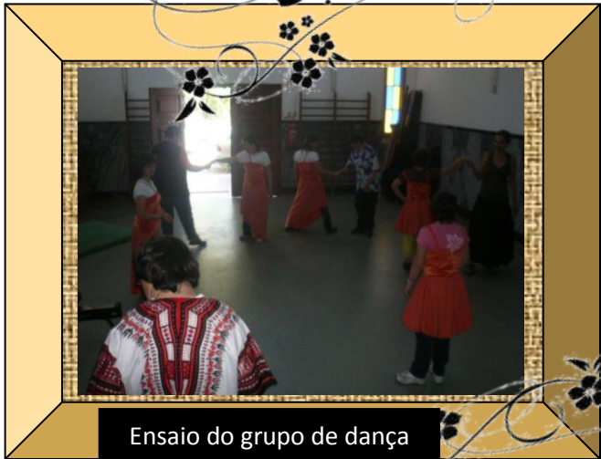
Ensaio do grupo de dança